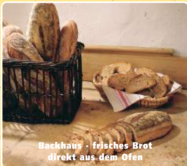
Backhaus - frisches Brot direkt aus dem Ofen