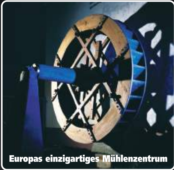
Europas einzigartiges Mühlenzentrum