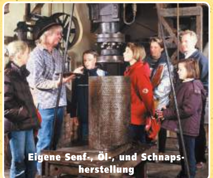
Eigene Senf-, Öl-, und Schnaps- herstellung