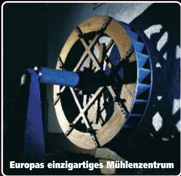
Europas einzigartiges Mühlenzentrum