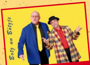
BOTZ UN BÖTZJE