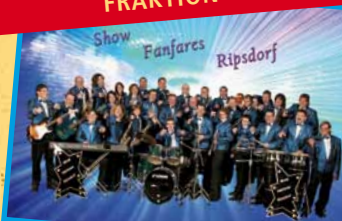
SHOW FANFARES RIPS DORF