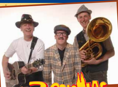
DIE 3 COLONIAS

Größtes Mittfastnachtfest in Deutschland