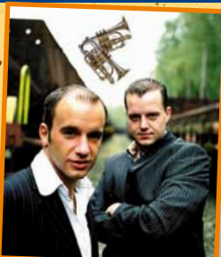
DIE JUNGEN TROMPETER