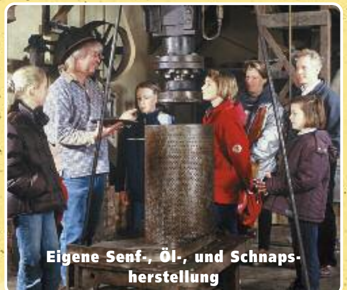
Eigene Senf-, Öl-, und Schnaps- herstellung