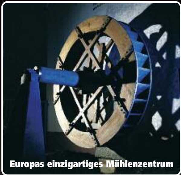
Europas einzigartiges Mühlenzentrum