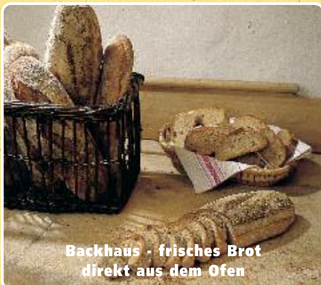
Backhaus - frisches Brot direkt aus dem Ofen